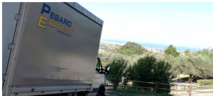
Pesaro Express Group