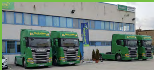
Palladino Logistics S.r.l.