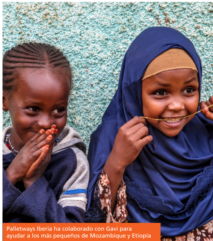
Palletways Iberia ha colaborado con Gavi para ayudar a los más pequeños de Mozambique y Etiopía

Alineada con las políticas de ESG y los Objetivos de Desarrollo Sostenible (ODS) de la ONU, Gavi apoya el acceso universal a vacunas que salvan vidas. Sus contribuciones, junto con el Matching Fund de la Fundación Bill y Melinda Gates y la Fundación "la Caixa", cuadruplican los esfuerzos contra la mortalidad infantil.