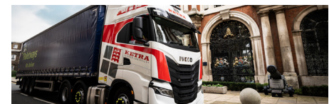
Ketra Logistics es uno de los cuatro miembros preseleccionados en los premios Motor Transport Awards de este año.

Los ganadores se anunciarán dentro de unas semanas.