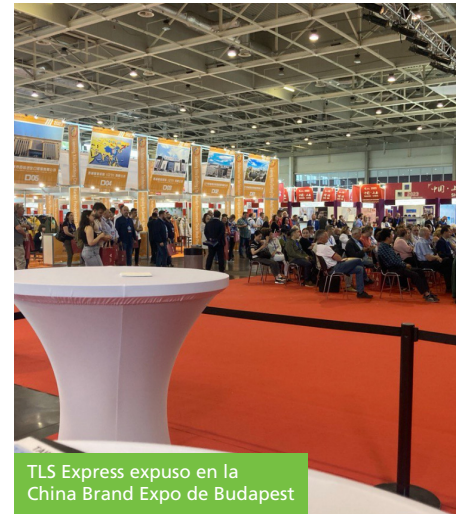
TLS Express expuso en la China Brand Expo de Budapest

"Estamos decididos a aumentar nuestra cuota de mercado y consideramos que las ferias son esenciales para aprovechar las oportunidades de crecimiento. La experiencia y los contactos adquiridos en esta feria contribuirán significativamente al éxito a largo plazo de TLS Express."