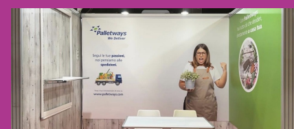
Palletways Italia fue patrocinador y socio logístico de Buyer Point

Cinemadivino -Grandes películas disfrutadas en la bodega- un festival itinerante de comida, vino y cine, organizado por bodegas de varios distritos italianos, principalmente de Emilia-Romaña. El festival combina el amor por el cine con los vinos locales, comienza en junio en la Casa Spadoni de Faenza y concluye a finales de agosto.