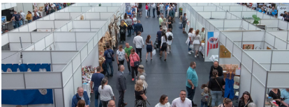
La asistencia a la Kiskun Expo permitió a Rollsped promocionar sus servicios Palletways entre un amplio público.

La Kiskun Expo, que se celebra en Kiskunfélegyháza (Hungría), conmemora el rico patrimonio cultural y económico de la región, y este año forma parte del Festival Tradicional y Cultural de la Semana de los Fundadores de la Ciudad.