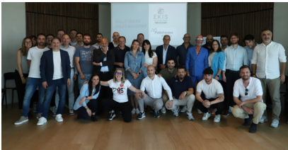
Palletways Italia acaba de lanzar su segunda edición de la Escuela de Ventas para apoyar a sus miembros actuales y potenciales.

Tras el éxito de la edición del año pasado, Palletways Italia acaba de lanzar el segundo curso de su Escuela de Ventas. En colaboración con un socio especializado, impartió formación para apoyar a los miembros actuales y potenciales de la red, con el objetivo de ayudarles a mejorar su enfoque comercial.