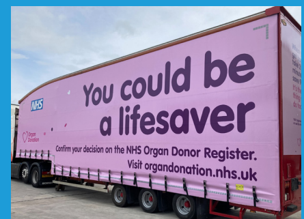
El remolque de Sovereign Transport

"La suerte quiso que acabáramos de encargar un nuevo vehículo cuando el NHS se puso en contacto con nosotros, y decidimos que mostrar la imagen de la donación de órganos en lugar de nuestra propia marca, nos permitiría contribuir a difundir este mensaje fundamental a escala nacional".