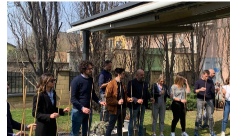
Los participantes tuvieron la oportunidad de mejorar sus habilidades empresariales, establecer contactos y mejorar las relaciones con sus compañeros.

sido posibles gracias al gran espíritu de equipo y al sentimiento de pertenencia de los asistentes, que también participaron en atractivas y divertidas actividades de team building, aplicando lo aprendido para pasar de la teoría a la práctica.