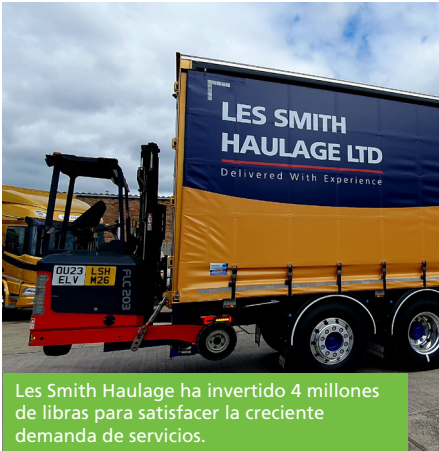
Les Smith Haulage ha invertido 4 millones de libras para satisfacer la creciente demanda de servicios.